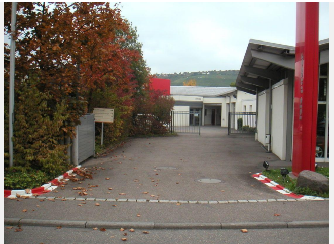
Zufahrt auf das Grundstück