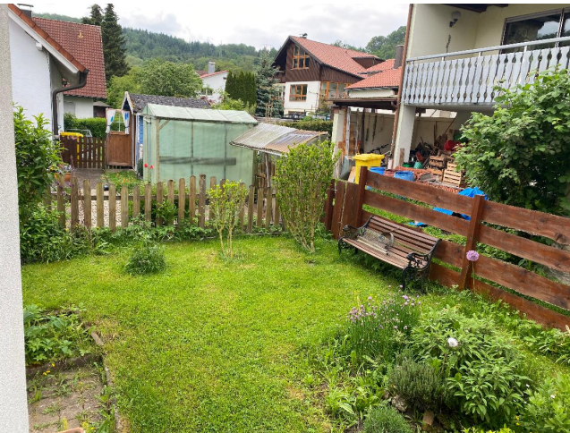
Ihr eigener Garten