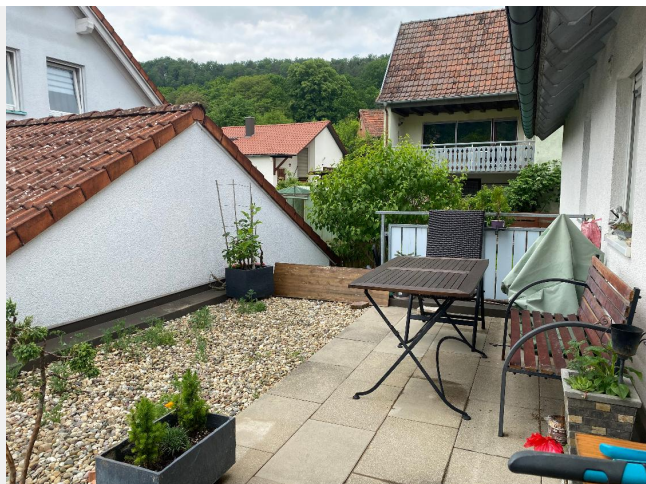
schöne Terrasse ...