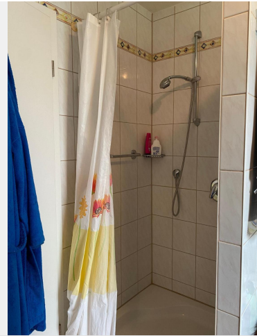
... und Dusche