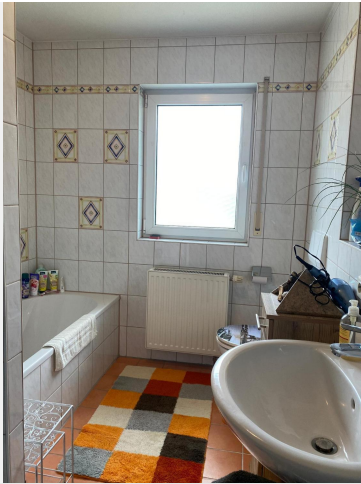
TL-Bad mit Wanne, WC ...