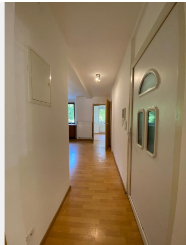
Eingang - Flur