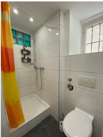
Ti-Bad mit Dusche und ...